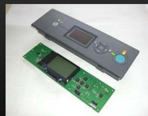
プリンター用パネルユニット