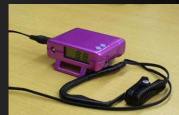
通信機能内蔵型心拍測定機