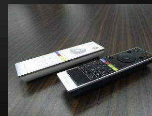
次世代型TV用リモコン

“Bridges to the Future of Electronics” —未来への架け橋となるために—